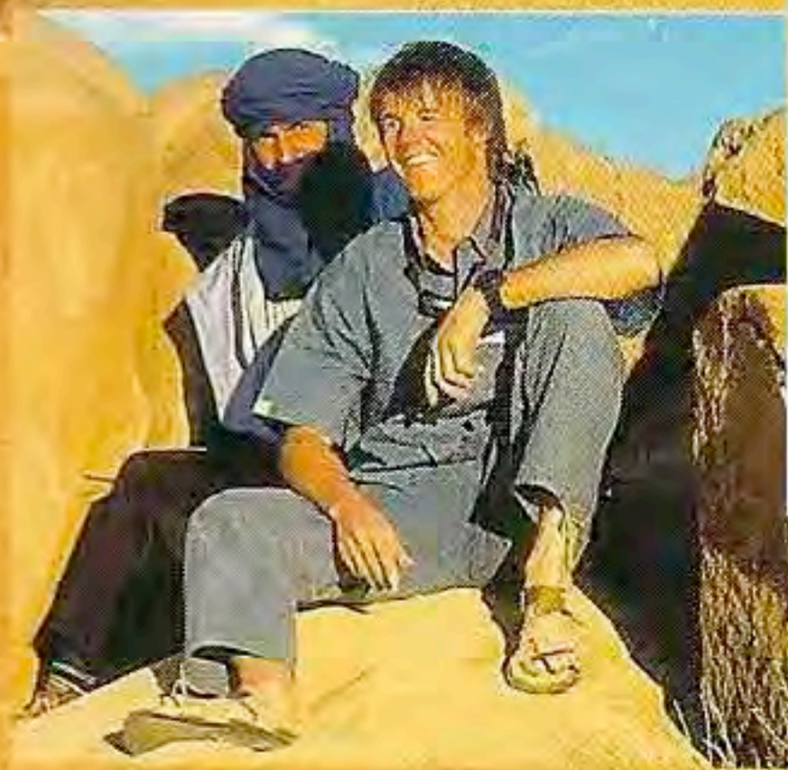
NICOLAS HULOT et son équipe sur les pistes du Ténéré